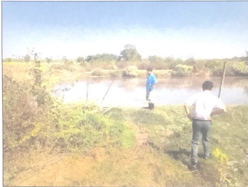
รูปภาพการออกตรวจสอบฟาร์มเลี้ยงสุกร การณัดาฟาร์ม ตั้งอยู่หมู่ที่ ๔ ตำบลโคกคอน เมื่อวันที่ ๒๒ ธันวาคม ๒๕๖๕